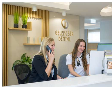
Gelencsér Dentallabor & Zahnklinik Hévíz

Tel: +36 30 686 3459 oder Email: bea.matusz@wefatours.com